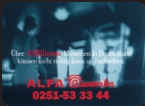
TV-Spot „The letter“

Freundin: Bücher machen doch auch Spaß. Mimi: Das ist so anstrengend. Freundin: Komm. Du schaffst das! Off: Schreib dich nicht ab. Lern lesen und schreiben.