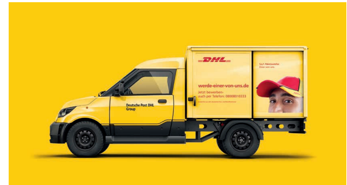
Mobiler Einsatz auf den StreetScootern von DPDHL

Das befürchtete Chaos rund um die Weihnachtssaison 2018 konnte so vermieden werden. Deutschland feierte schließlich ein friedlich besinnliches Krippenfest – zumindest waren eventuelle Familiendramen nicht durch fehlende Geschenkpakete oder Weihnachtskarten begründet :-).