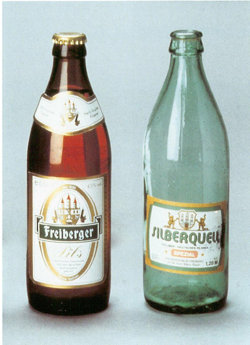
Freiburger Pils - eine neue Produktausstattung