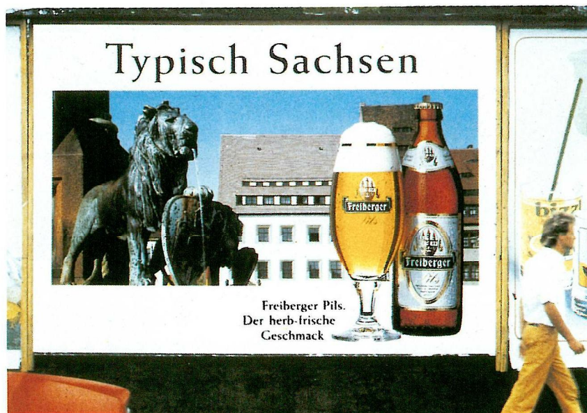
18/1 Plakat, 1. Motiv "Typisch Sachsen"-Kampagne "Löwe"